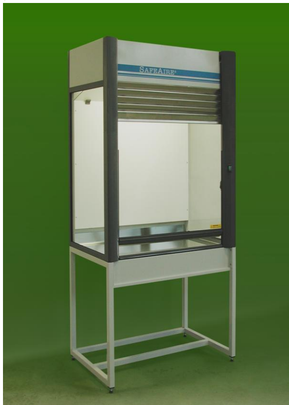
Freistehender SafeAire S-1200 Abluftabzug mit offenem Gestell (Gesamthöhe: 240 cm)

Die S-Abzüge werden komplett montiert geliefert so dass die ohne zusätzliche Montagearbeiten aufstellbar, und an das hauseigenem Abluftsystem anschließbar sind..